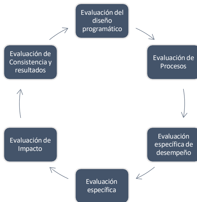
Figura1.1 Tipos de evaluación de Programas Presupuestarios.